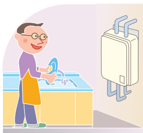
密閉燃焼式 ガス瞬間湯沸器・ガスバーナー付きふろがま