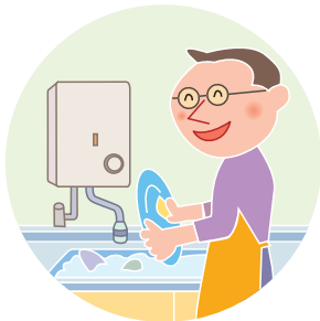
開放燃焼式 ガス瞬間湯沸器